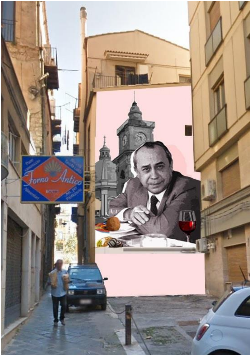
Bozza digitale del murale che è stato realizzato giorno 11 maggio presso via Scovazzo