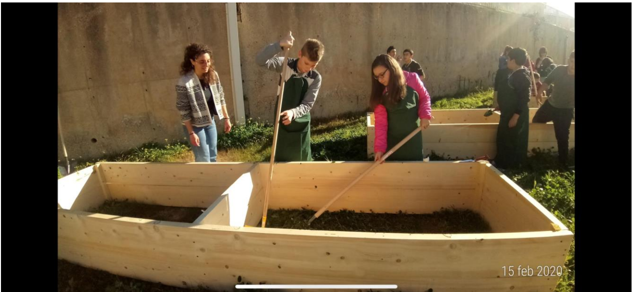
Orto di Comunità già costruito da Legambiente ad Agrigento nel 2020