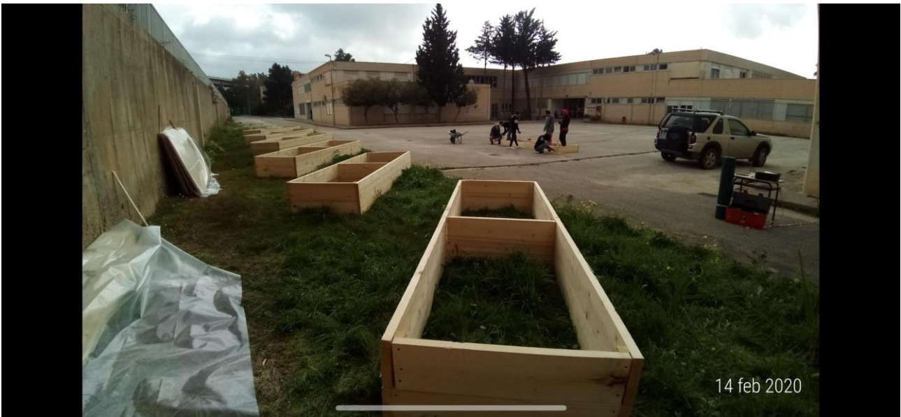
Orto di Comunità già costruito da Legambiente ad Agrigento nel 2020