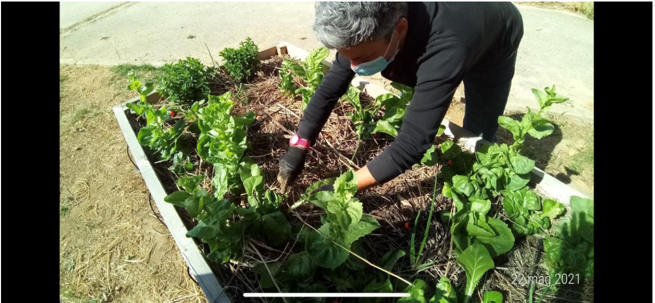
Orto di Comunità già costruito da Legambiente ad Agrigento nel 2020